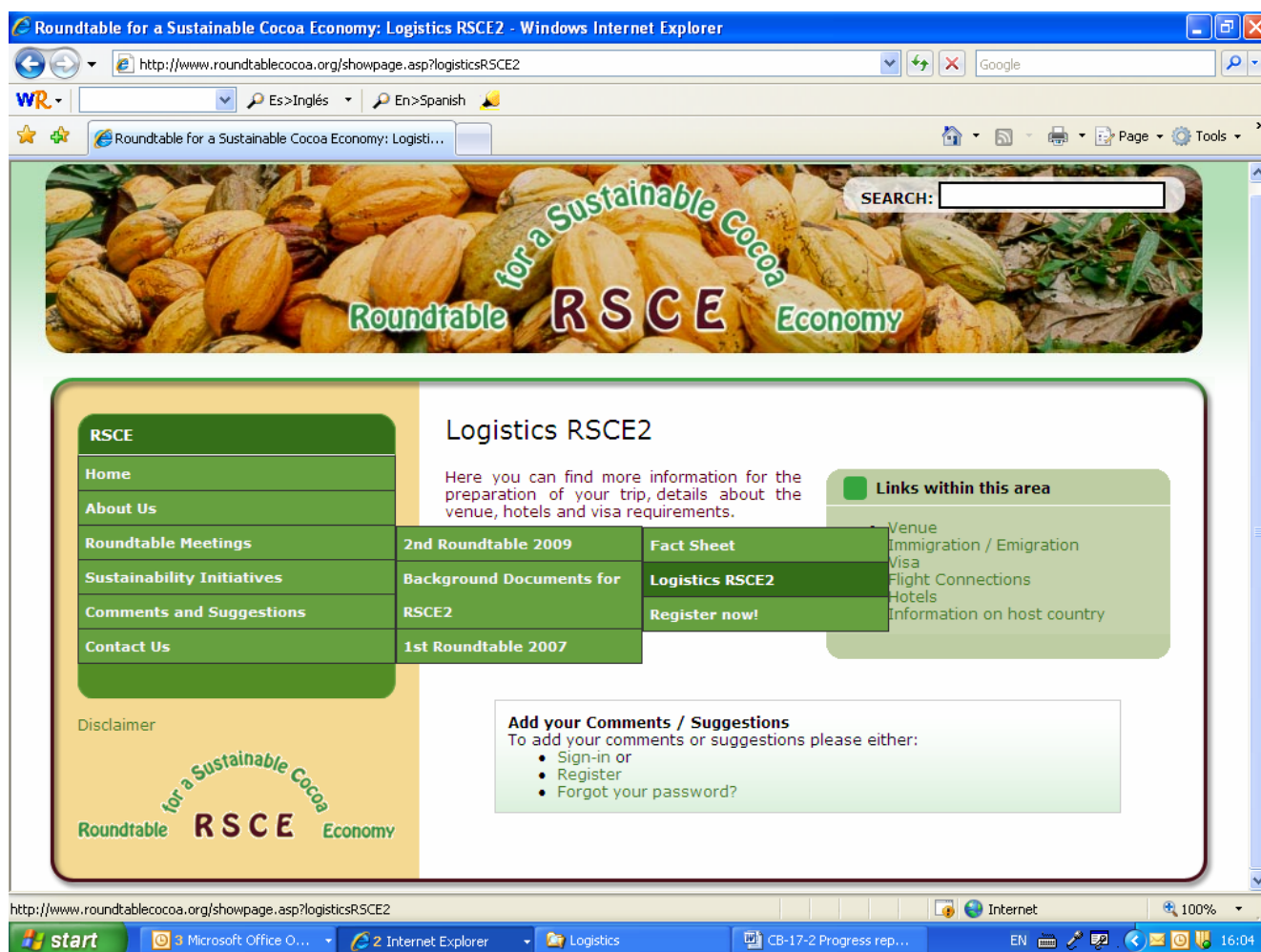
Figura I: Captura de pantalla del sitio web de la Mesa Redonda que muestra la información logística proporcionada

6. El Hyatt Regency Trinidad, hotel de cinco estrellas, ofrece alojamiento de categoría superior y unas prestaciones excelentes para conferencias, además de traslados a, y desde, el aeropuerto. Dadas las tarifas muy competitivas ofrecidas por el hotel, y teniendo en cuenta la densidad del tráfico en Puerto de España en horas punta, RSCE2 no facilitará traslados entre otros hoteles y el Centro de Conferencias del Hyatt Regency. Se recuerda que el código de descuento de grupo “G-RSCE” debe citarse en todas las solicitudes de reserva. Las reservas se pueden realizar en línea en el sitio web del hotel http://trinidad.hyatt.com , introduciendo el código de descuento de grupo “G-RSCE” en el campo “grupo/corporativo” para obtener las tarifas especiales. La reserva también se puede realizar por teléfono , llamando al Hotel: +1 868 623 2222, o bien enviando por fax la hoja de reserva debidamente rellena al número de fax : +1 868 821 6401, o por correo electrónico a: trinidad.reservation@hyattintl.com . (Para mayor comodidad, la hoja de reserva se puede descargar del sitio web de la Mesa Redonda, en la sección de “documentos relacionados”: http://www.roundtablecocoa.org/showpage.asp?hotels )